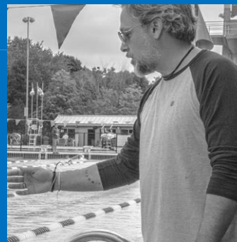
ENTRAÎNEUR EN TRIATHLON